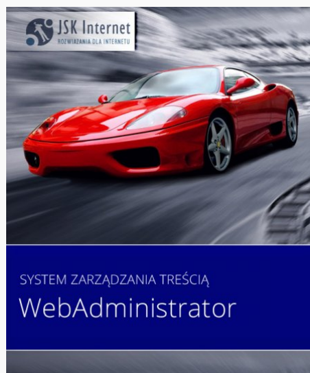
WebAdministrator dla Dealerów

strona dla dealera , strona dla autokomisu , program dla dealera , program dla komisji , program dla autokomisy